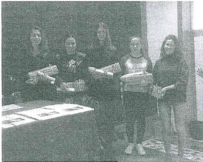
Le studentesse premiate ieri al liceo Fogazzaro. AN.MA.

Dei lavori esaminati ne sono stati individuati e selezionati cinque da una giuria